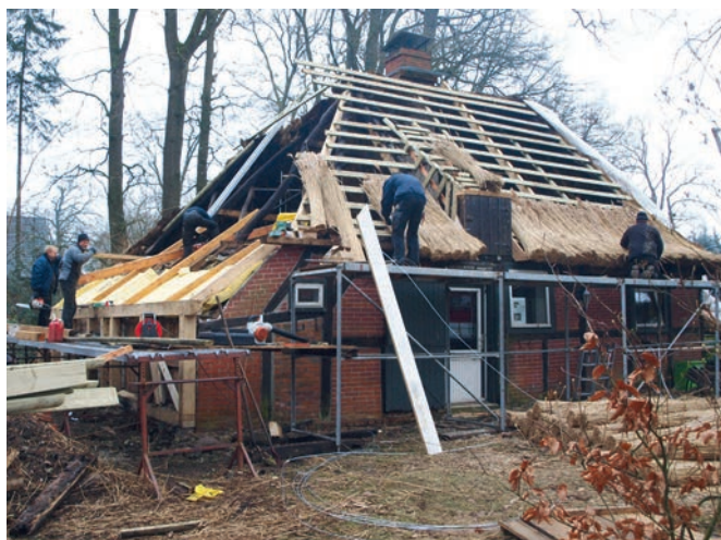
Ein neues Reetdach für das Hexenhaus