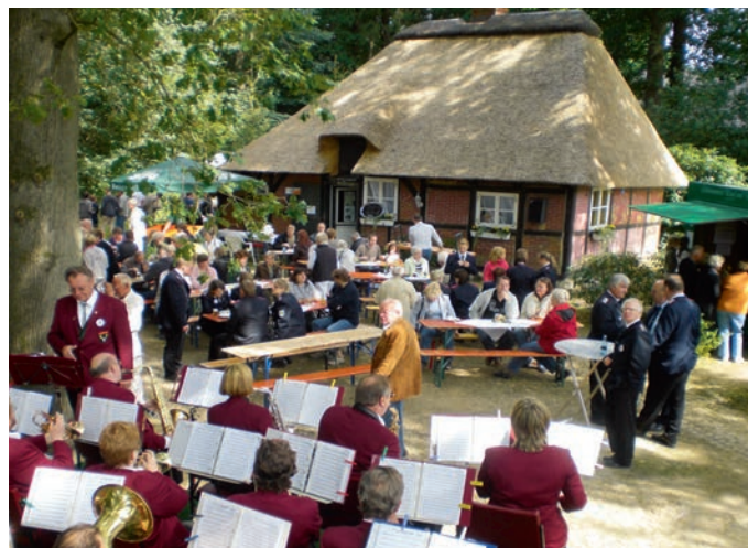
Dorffest am Hexenhaus