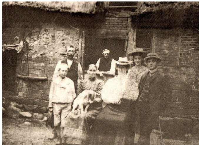
Die ersten Touristen aus der Stadt

Der Name beruht auf der hexenhausartigen verwinkelten Bauweise. Die Bezeichnung des Standortes „Höllenhoff“ weist auf die zahlreichen Stechpalmensträucher im umgebenden Eichenwald hin (von „Hülse“ oder „Holler“ für Ilex. Engl. „Holly“).