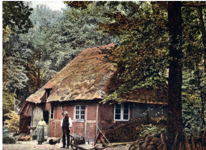
Postkartenmotiv ca. 1898

Das Hexenhaus ist ein ausdrucksvoller Zeuge örtlicher Wirtschafts- und Wohnverhältnisse der vergangenen drei Jahrhunderte. Es wird von der Landesdenkmalbehörde als schützenswertes Einzeldenkmal geführt.